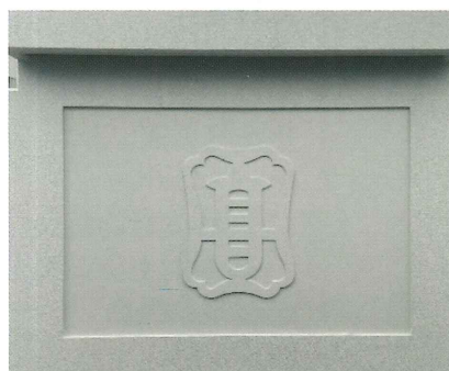
正門に表現された校章